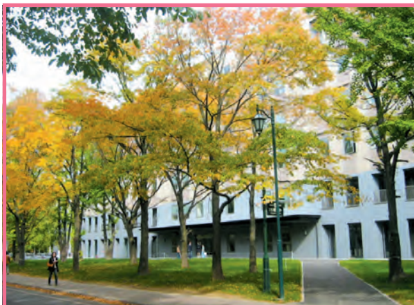
■実施会場：人文・社会科学総合教育研究棟1階(W103室)