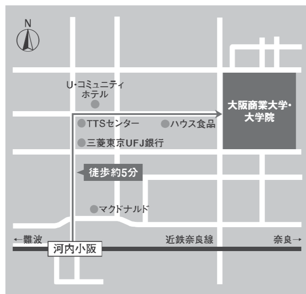
近鉄奈良線「河内小阪駅」(準急停車)下車、北東へ約5分